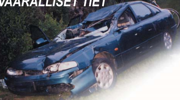
Oulun tiepiiri, yleiset tiet Hirvionnettomuudet vuosittain • v. 2001 • v. 2002 • v. 2003