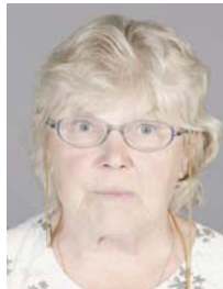
5) väärin: ylivalottunut