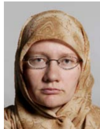
7) väärin: huivin varjo