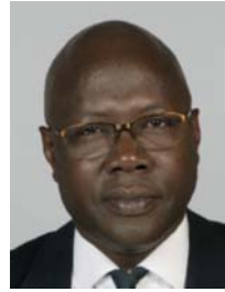
4) väärin: pää kallellaan