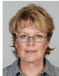
8) väärin: silmät peittyvät