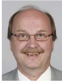
2) väärin: hymy suu auki