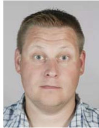
3) väärin: kulmat koholla