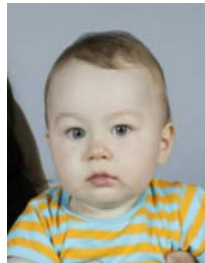
7) väärin: ei yksin kuvassa