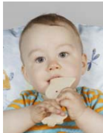
6) väärin: lelu, taustalla tyyny