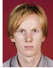
4) väärin: tumma tausta