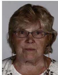
6) väärin: alivalottunut