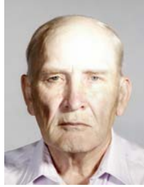
2) väärin: kirkaspiste otsassa