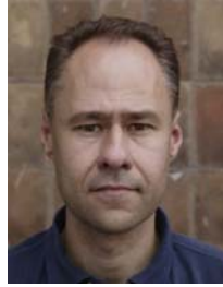
3) väärin: kuvioitu tausta