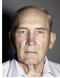
3) väärin: sivualo/varjo