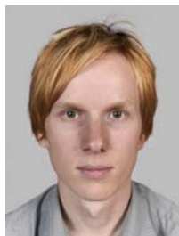
5) väärin: optinen vääristymä