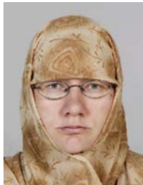
6) väärin: otsa peitossa