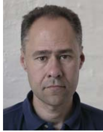
2) väärin: epätasainen tausta