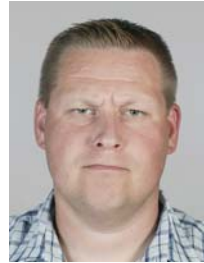
4) väärin: silmät sirillä