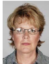
9) väärin: heijastuksia