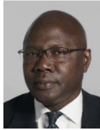
3) väärin: pää vinossa