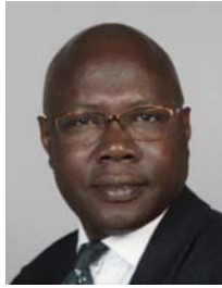
2) väärin: hartiat vinossa